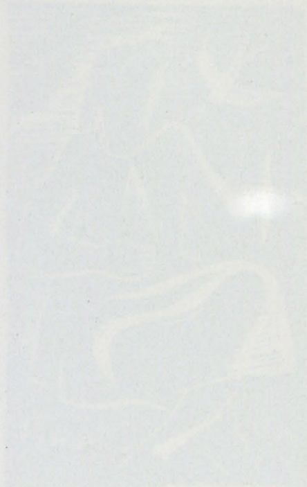
Alma de la artista, en un momento de su vida.