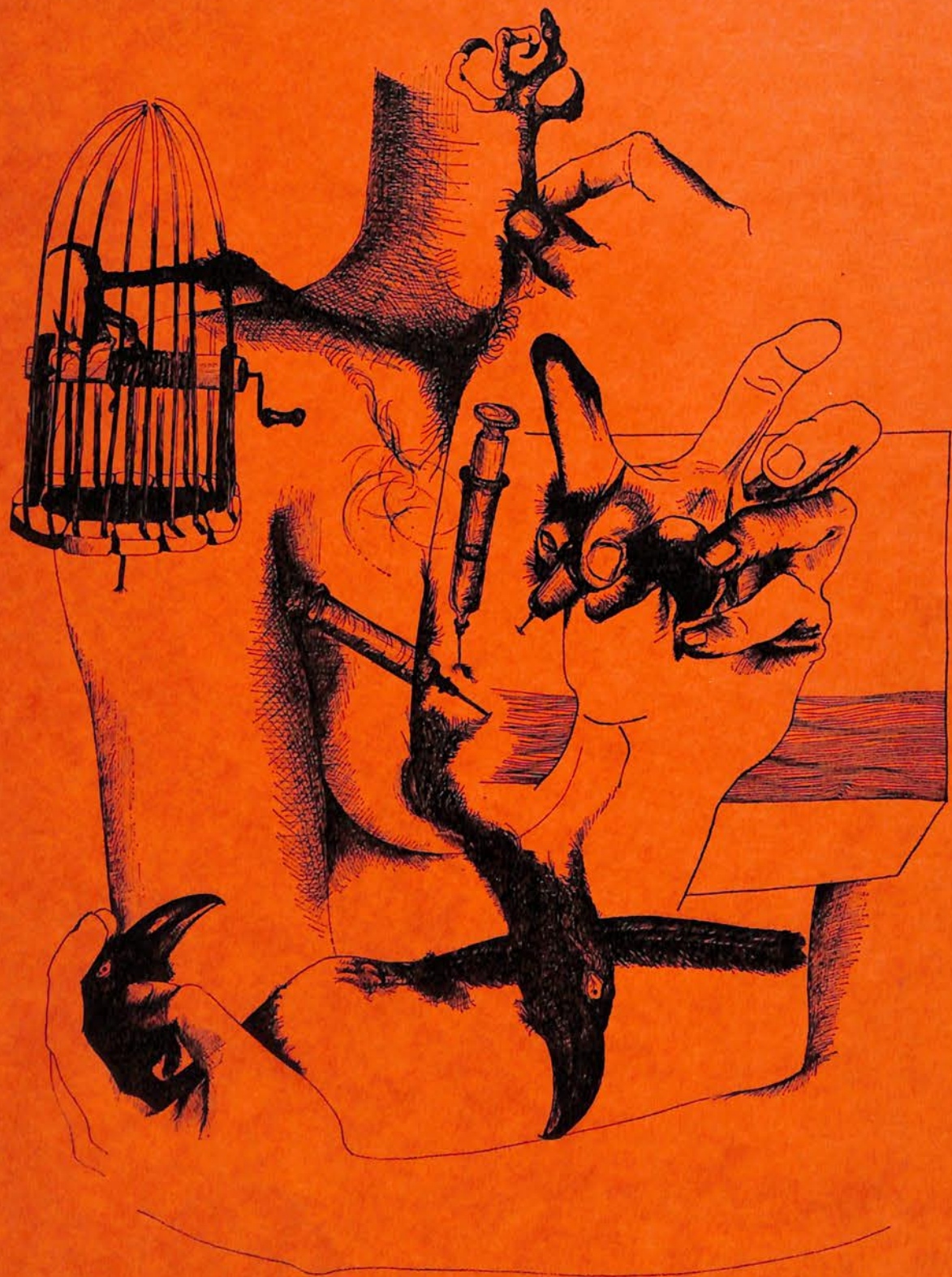
DIBUJO A PLUMA. Susana Wald