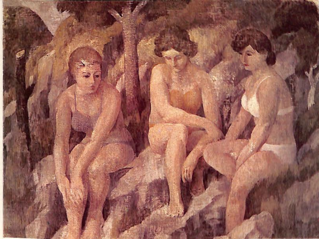
MUJERES AL RIO (OLEO 60x50)