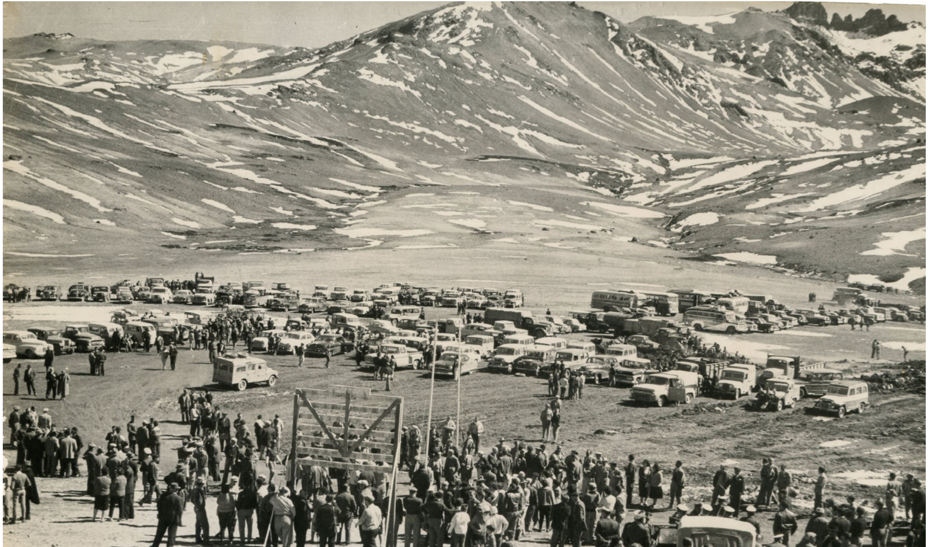
Encuentro binacional chileno-argentino, Paso Pehuenche. Fondo Benito Riquelme, Centro de Documentación Patrimonial UTALCA.