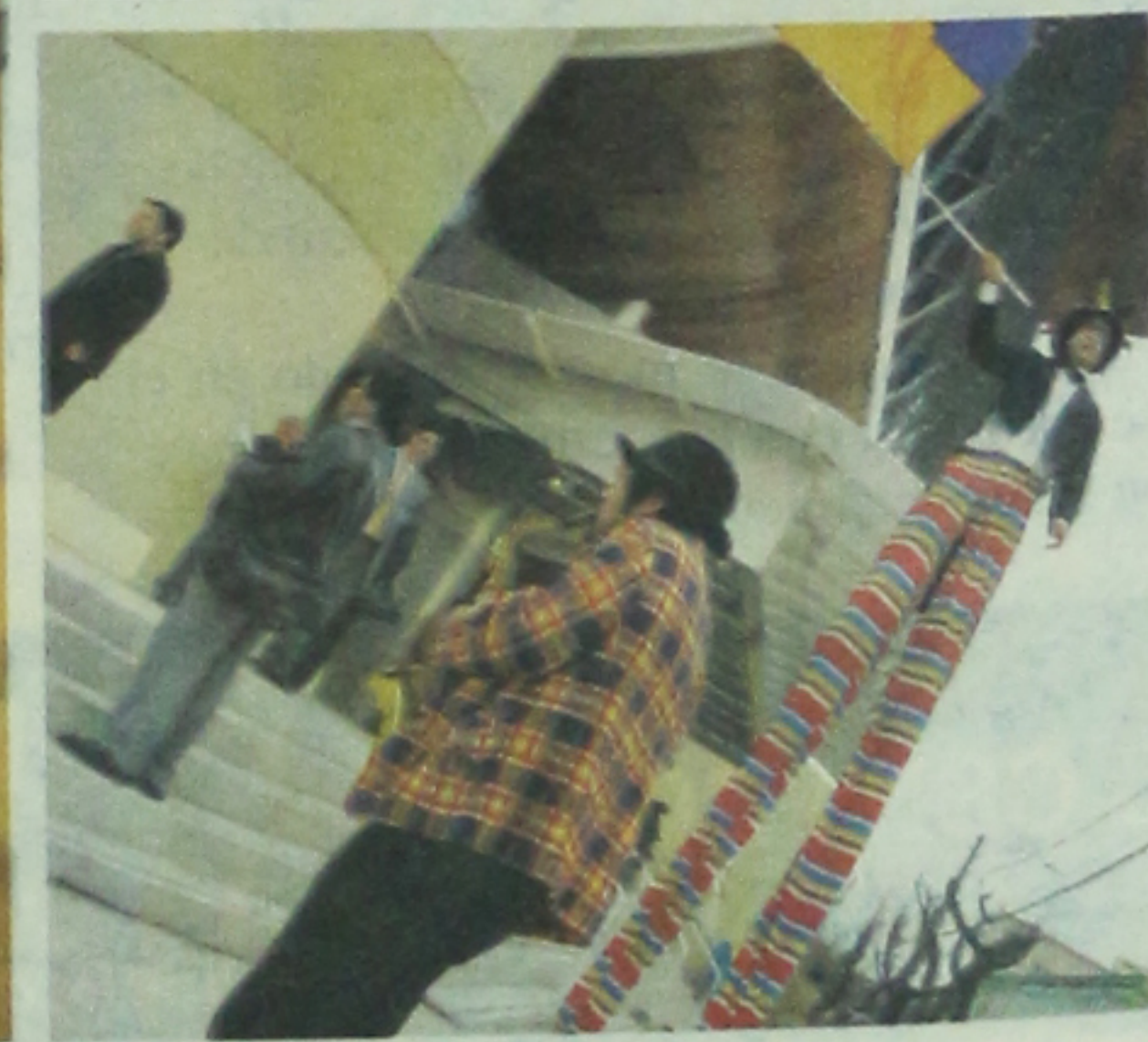
En las afueras del recinto, mientras se esperaba el arribo del Presidente Ricardo Lagos la calle se transformó en una fiesta con mimos, zancos y payasos ejecutando en directo sus instrumentos