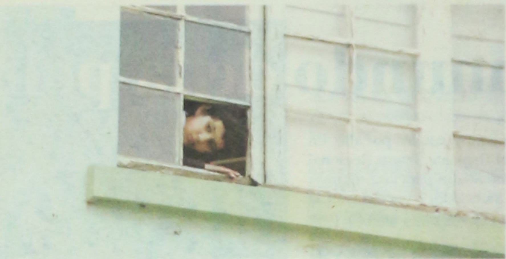
Mirando desde una ventana el terremoto cultural del siglo en Talca