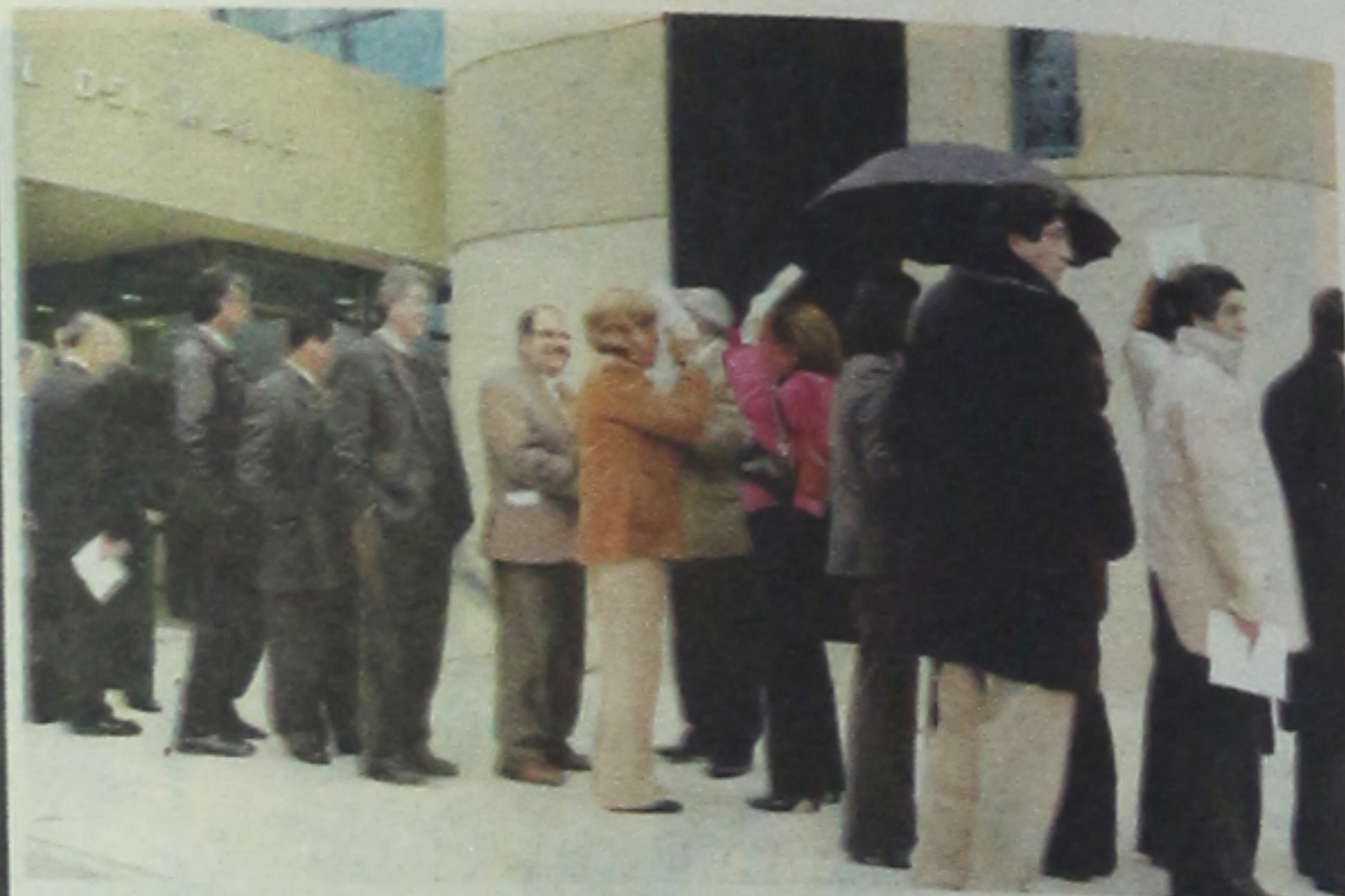
Una lluvia tenue acompañó a quienes llegaban invitados al momento histórico de la inauguración