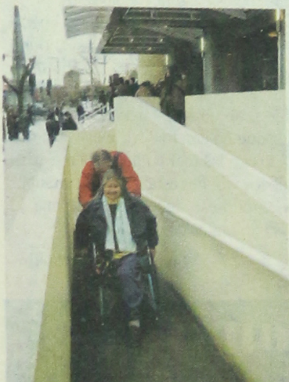
Los minusválidos invitados subieron por la rampa de acceso