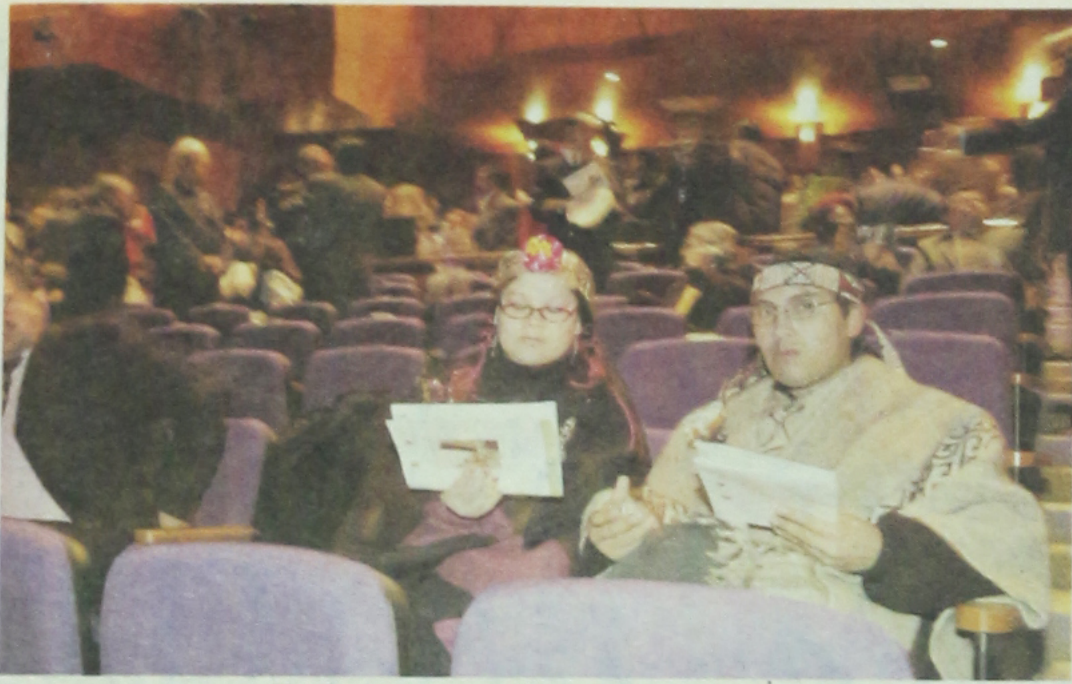
... Y todas la razas convivieron bajo el mismo techo