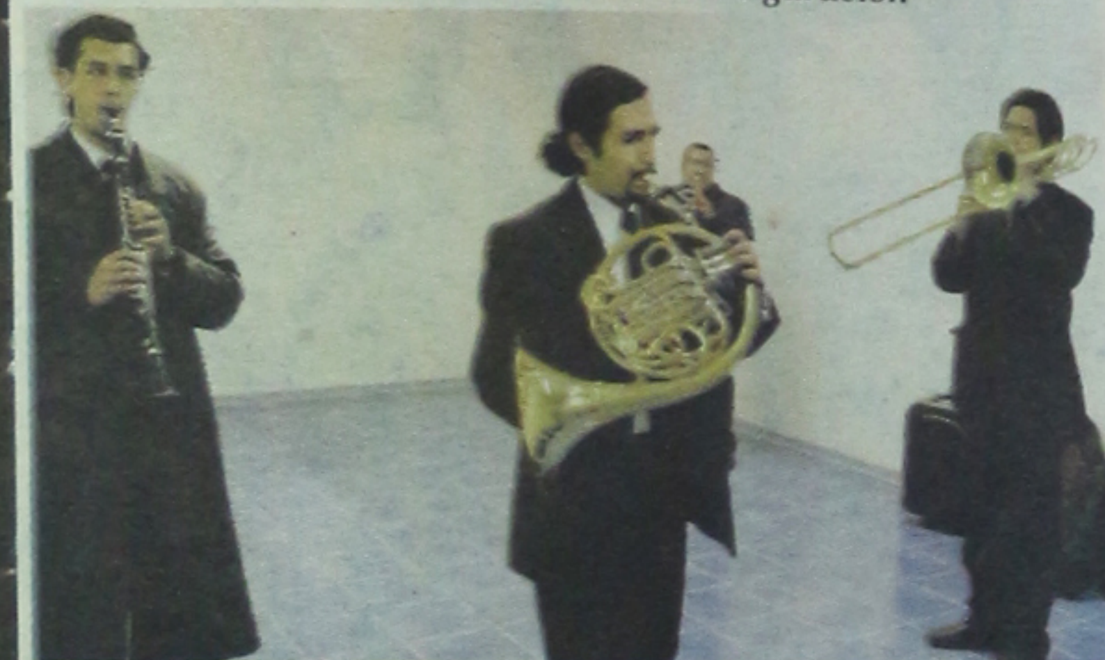
El ensayo fue frenético en las entrañas del templo cultural. Afuera la gente esperaba romper el maleficio de 37 años sin teatro