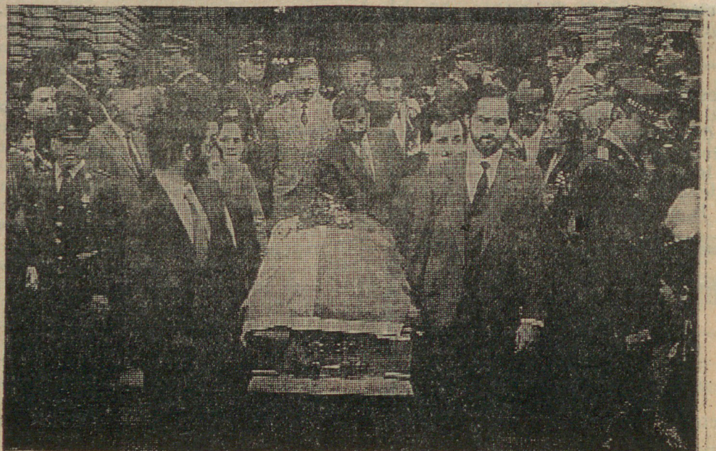
Los hijos del destacado hombre [público transportan la urna, a la salida de la Catedral de Linares.