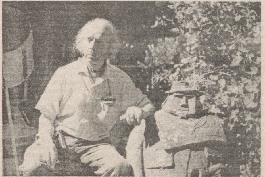
En los últimos años de su vida, en el patio de su casa y taller, de calle Freire con Y. Buenas, junto a una de sus creaciones que lo adornan.

Se destacan el Primer Premio de Escultura de la Casa del Arte de Talca (1965); lo mismo en el XXVI Salón de Artes Plásticas del Centro de Amigos del Arte de Talca (1971); Premio