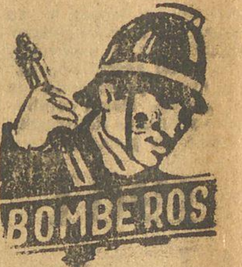
PRIMERA COMPANIA (Trabajo y Disciplina) Se cita a la Compañía a las 12.30 horas con tanda de parada.

Para el sábado próximo 24 del presente, se ha anunciado el arribo a nuestra capital, del equipo masculino de básquetbol norteamericano de la Universidad de St. Joseph, Filadelfia, conjunto que llegará a fin de disputar en Santiago, Valparaíso y Concepción algunos partidos, así como también en dar algunos foros o conferencias sobre este deporte con árbitros y entrenadores nacionales.